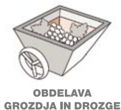
OBDELAVA GROZDJA IN DROZGE