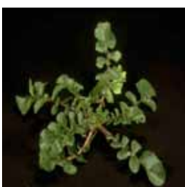
Njivska redkev, Raphanus raphanistrum

zatira najpomembnejše širokolistne plevela. Odlikuje ga odlično delovanje na plezajočo lakoto (smolenec), njivski osat, kamilice, jetičnike, navadno zvezdico, njivsko redkev in koprive. V zgodnjih razvojnih fazah zatira tudi navadni srakoprec.