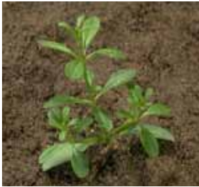
Plezajoča lakota ali Smolenec, Galium aparine

Izbiro termina zatiranja narekuje sestav in številčnost plevelne flore: