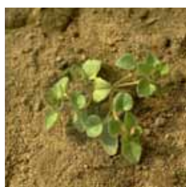
Bršljanastolistni jetičnik, Veronica hederifolia